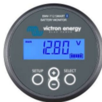
Contrôleur de batterie BMV-712 Smart