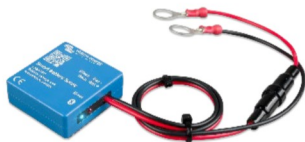
Smart Battery Sense Permet d'activer la charge à compensation de tension et de température.