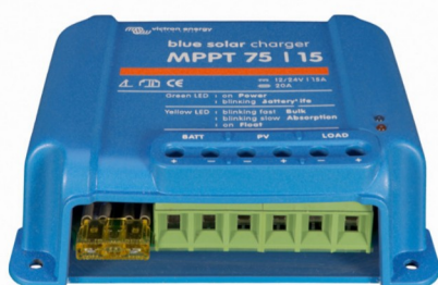
Contrôleur de charge solaire MPPT 75/15